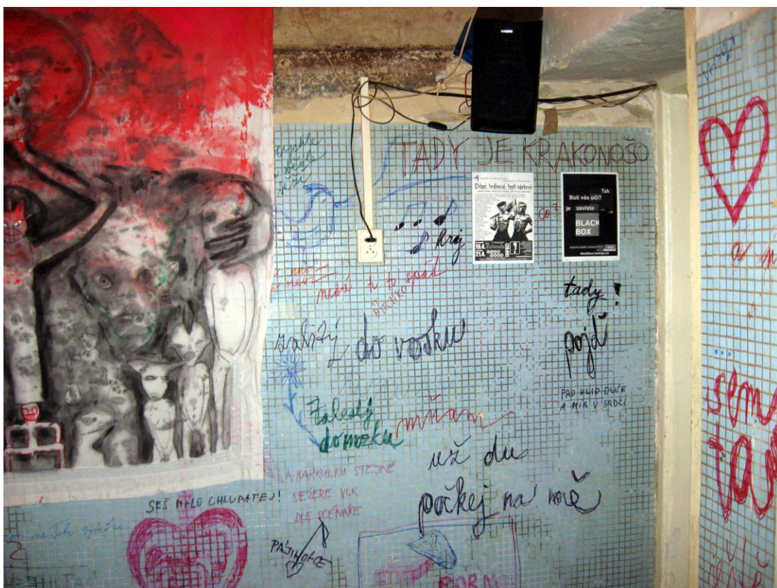
Obr. 33 - 34: Dívej se na mě když s tebou mluvím , 2010. Interaktivní výstava, Washclub, Brno.