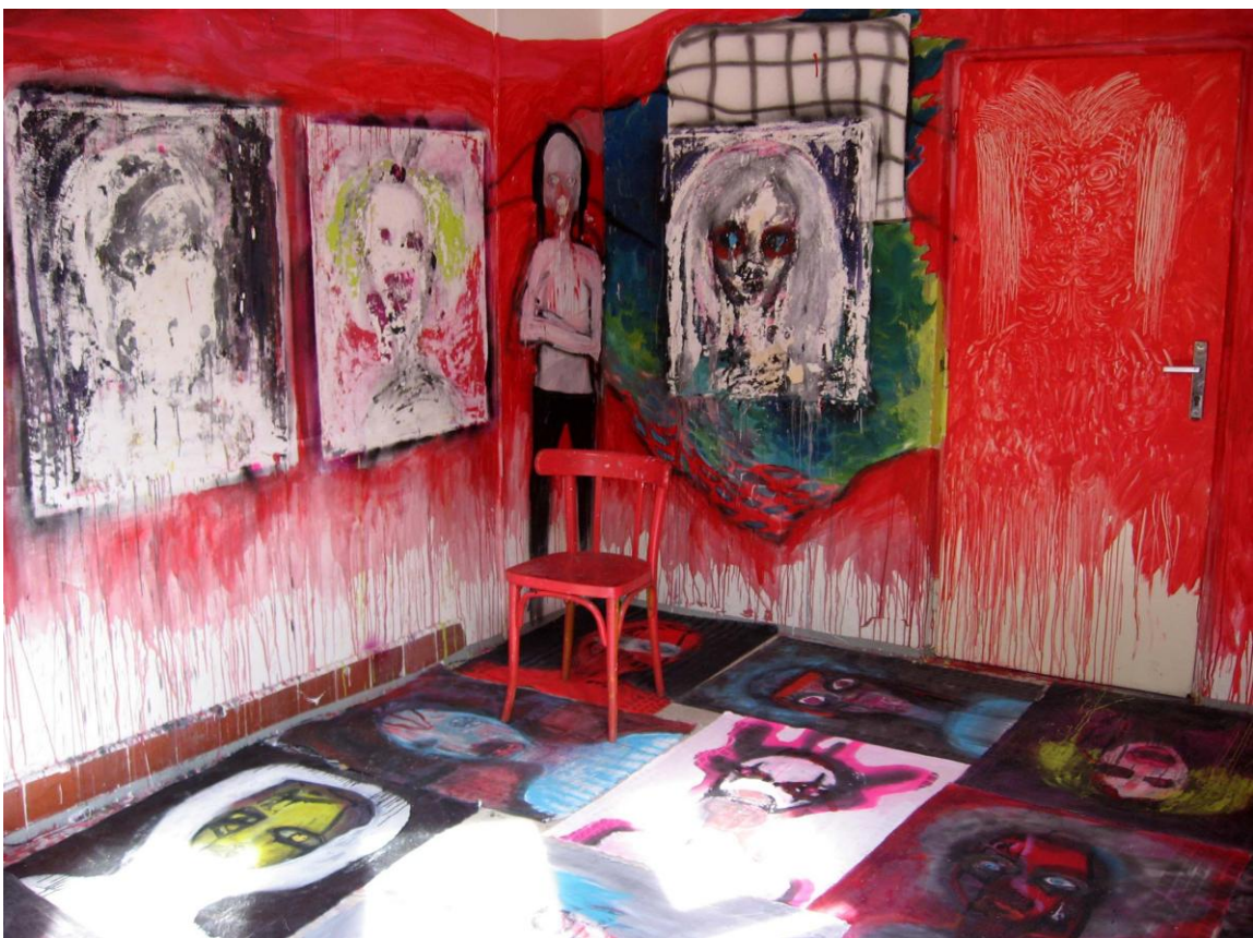
Obr. 31 - 32: Pokoj – nepokoje , 2009. instalace, klauzurní práce na FaVU v Brně (LS).