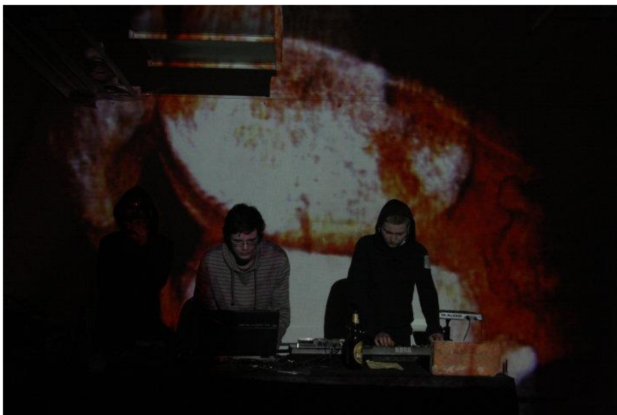
Obr. 37 - 38: Piča z hoven , 2010. koncert ve Starém pivovaru, Brno a v Galerii Dvanáctka ve Zlíně.