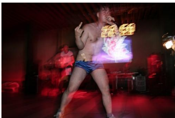
Obr. 19: I love 69 popgejú , koncert - Klidek fest , 2009.