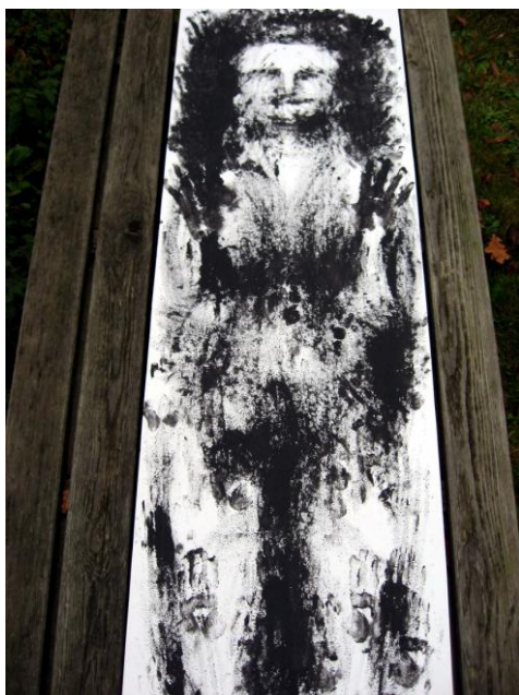
Obr. 27 - 28: Pohřbeni v Německu , 2007. Instalace v parku, Sauen, Německo.