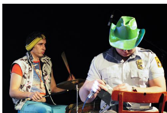
Obr. 21: To žluté co máte na kalhotkách , koncert, 2009.