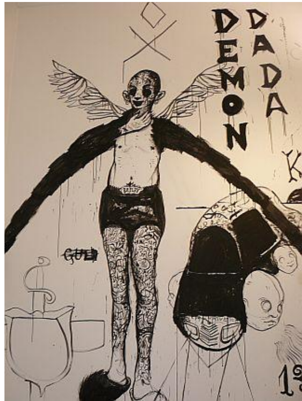
Obr.4 - 5: Jakub Janovský - Kango mortale , 2009. Instalace v Galerii U Zlatého prstenu, Praha.