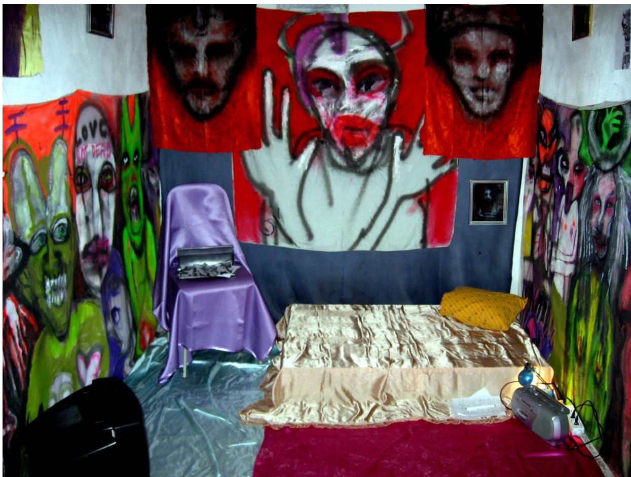
Obr. 30: Moje černé svědomí , 2009. instalace, klauzurní práce na Fakultě umění OSU v Ostravě (ZS).