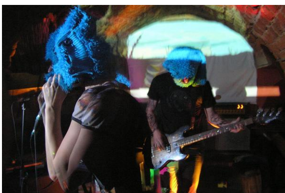
Obr. 20: Like she , koncert, 2008.