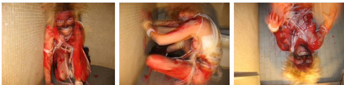
Obr. 12 – 14: Očista , 2007. Video.