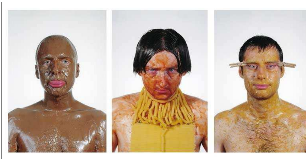
Obr. 11: Kamera Skura - Žijeme tady s vámi (I.) , 2002. Fotografie, 3x (100x150cm).