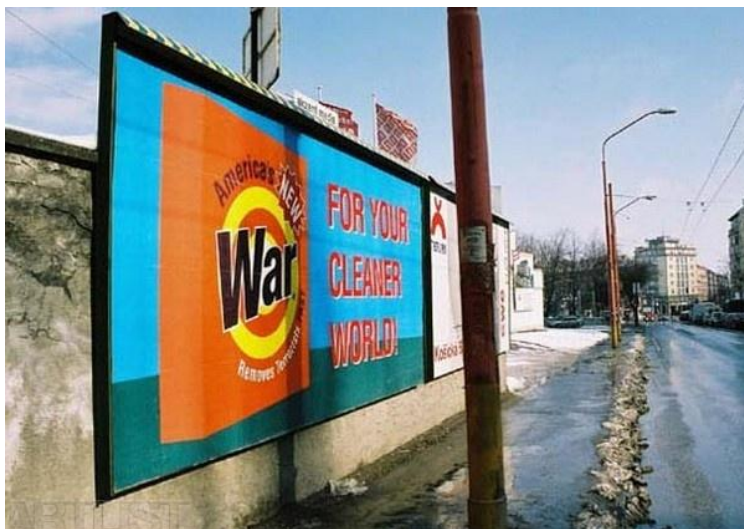
Obr. 12: Guma Guar – Billboards , 2004, Bratislava.