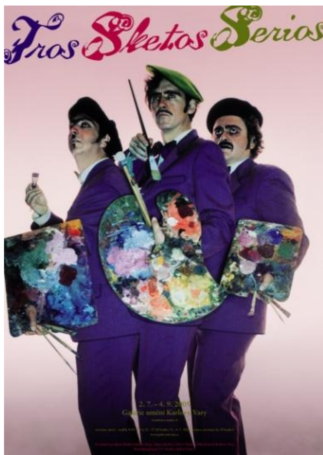
Obr. 14: Tros Sketos, 2005. Plakát