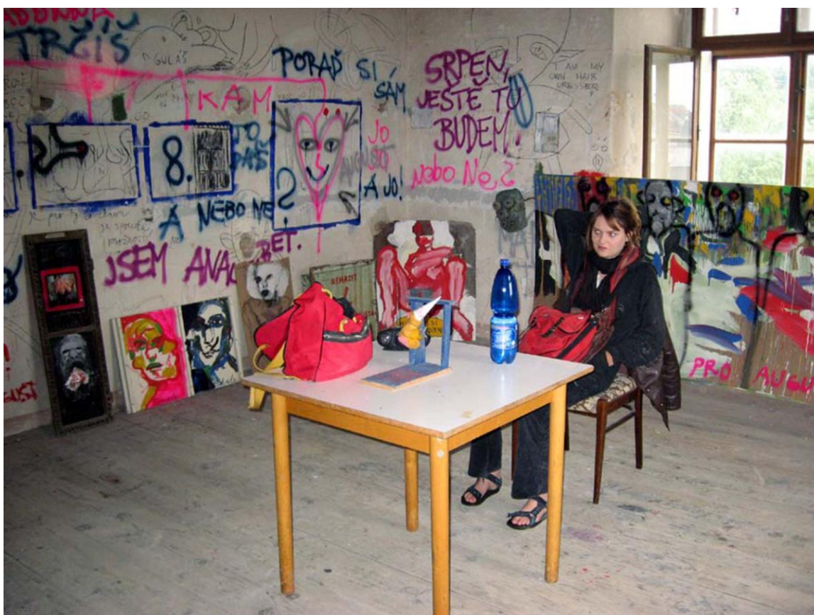
Obr. 21: Chorál pro Augusta , 2007. Instalace v augustiniánském klášteře, Šternberk.