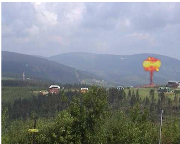
Obr. 13: Ztohoven - Mediální realita , 2007. Akce, Praha.