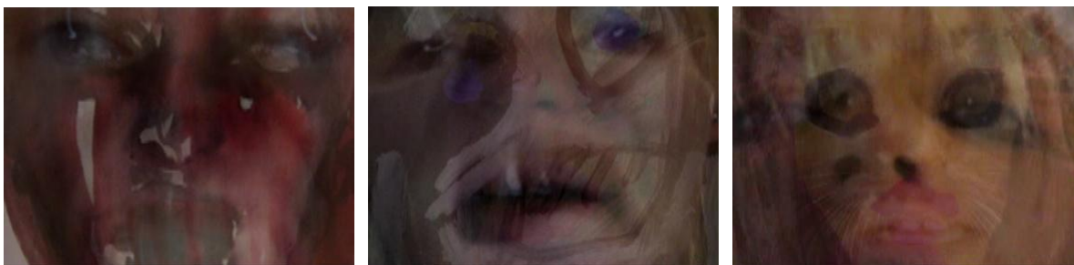
Obr. 18 - 20: Živo-mrtvo , 2008. Video.