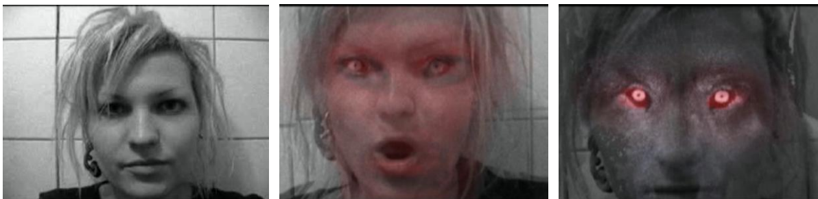
Obr. 15 – 17: Měním se , 2008. Video.