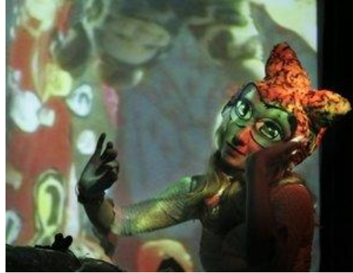
Obr. 15 - 16: Mateřídouška , 2008. Koncert na Flédě v Brně.