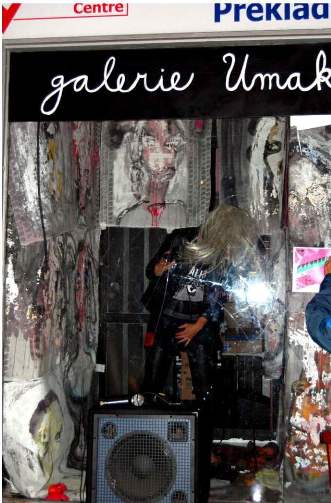
Obr. 39 – 41: HC – UMA – CORE aneb Napij se a zařvi si se mnou! 2010. Performance, Galerie Umakart v Brně.