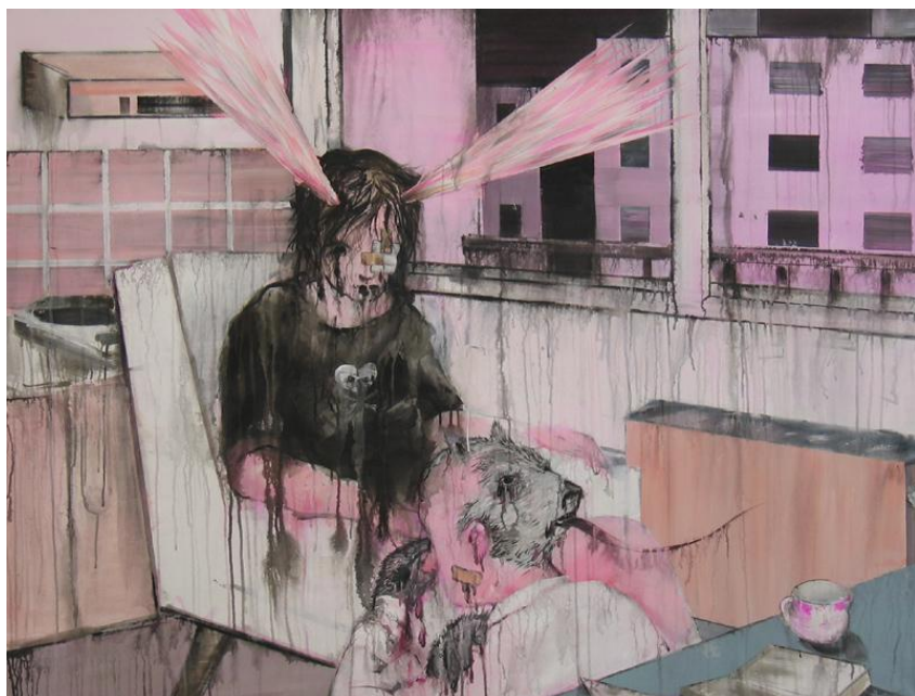
Obr. 1: Josef Bolf - Spolu doma , 2007. Akryl, tuš, plátno, 114 x 150 cm.