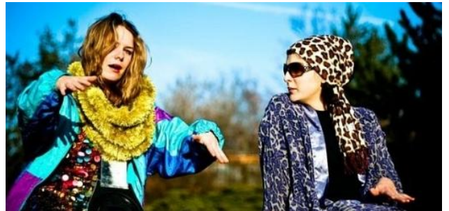
Obr. 17 : Čokovoko . Obr. 18 : Čokovoko , koncert Kulturní klub, Sušice, 2009.