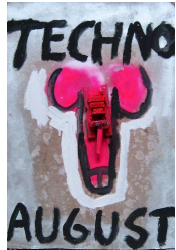
Obr. 22 - 23: Chorál pro Augusta , 2007. Instalace a obrazy v augustiniánském klášteře, Šternberk. Obr. 24 – 26: Obrazy z cyklu Chorál pro Augusta , 2007. Kombin. technika, 65x55/80x65/70x55cm.